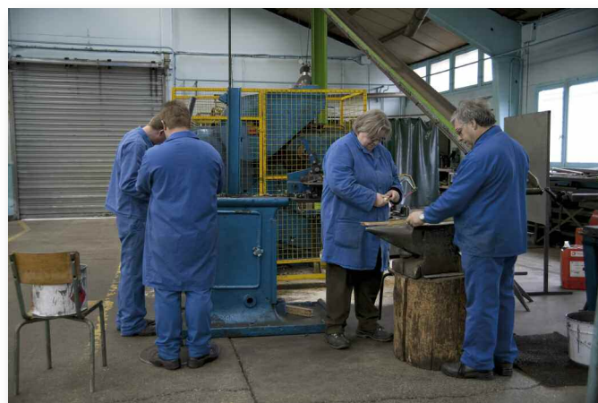
© Claire Chevrier > G 03 / 2010

MERCI DE NOUS CONTACTER POUR RECEVOIR DES VISUELS DE PRESSE