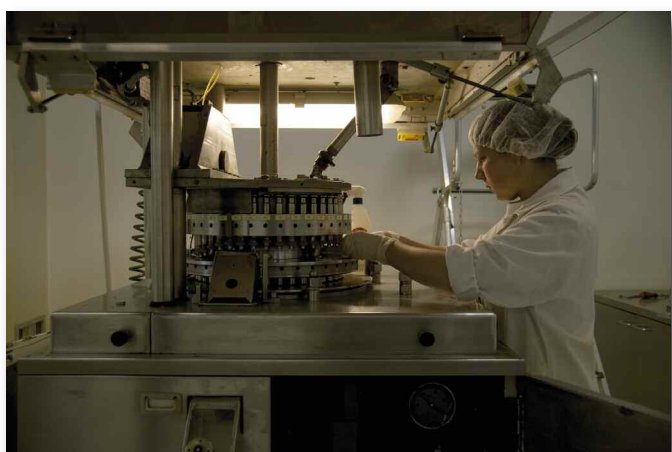
© Claire Chevrier > GR 01 / 2010