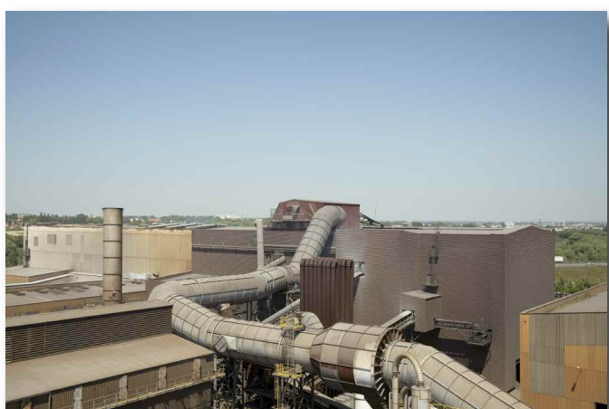
© Claire Chevrier > EE 11 / 2010