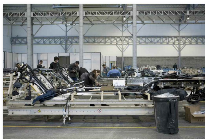
© Claire Chevrier > PE 32 / 2011